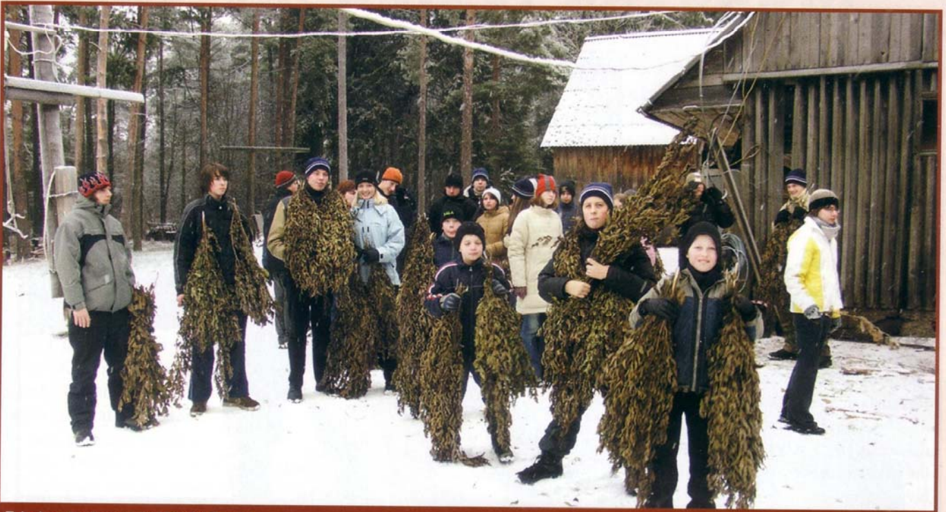
Talvelaagris ei unustatud ka ulukihoolet.